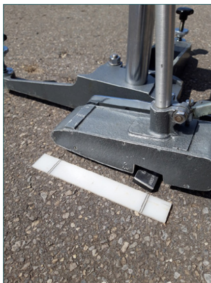
Figuur 3 – Maat met lengte 126 mm