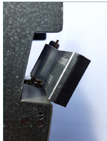
Figuur 2 – Rubberplaatje aan het uiteinde van de arm van de SRT-slinger