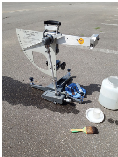
Figuur 1 – De SRT-slinger

Al naargelang men het slipgevaar voor voertuigen of het valgevaar voor voetgangers wil evalueren, gebruikt men een ander rubberplaatje: het zogenaamde rubberplaatje "57" (of de iets zachtere variant "55") is zacht en representatief voor voertuigbanden. Het wordt soms ook aangeduid als het "ISO"-rubberplaatje. Het rubberplaatje "96" is hard en vertoont de eigenschappen van schoenzolen. Dat plaatje wordt ook het "4S"-rubberplaatje genoemd, wat staat voor Standard Shoe Sole Simulation . Studies uitgevoerd in de jaren 1980-1990 [2] geven aan dat er een vrij goede correlatie bestaat tussen enerzijds het resultaat van de SRT-slinger met het "4S"-rubberplaatje en het valrisico bepaald door wandeltesten op diverse oppervlakken in laboratoriumomstandigheden: de correlatiecoëfficiënt bedraagt ca. 0,8.