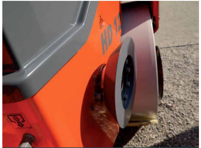
Figuur 3 - naadverdichtingsrol

Het doel van deze maatregelen is om de langse naden structureel te versterken, zodat ze beter bestand zijn tegen de spanningen die ontstaan door thermische krimp, en waardoor de kans op naadopeningen en daaropvolgende reflectiescheuren naar de toplaag toe aanzienlijk vermindert. Deze aanpassingen vormen een eerste stap in het beheersen van het scheurfenomeen bij AVS-B onderlagen op basis van hard wegebitumen. Verdere opvolging van proefvakken en praktijkervaring zal uitwijzen in welke mate deze maatregelen effectief bijdragen aan een verhoogde duurzaamheid van de verharding.