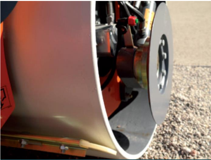
Figuur 2 – Kantijzer gemonteerd op een wals